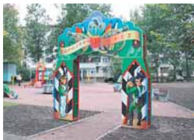
Благоустройство, стр. 5