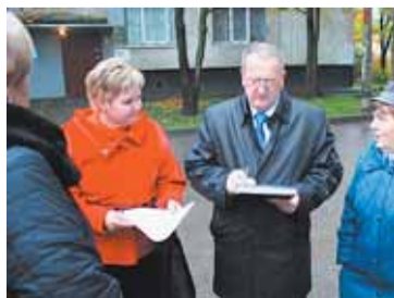
Объезд по средам, стр. 2