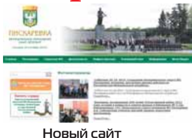
Новый сайт МО Пискаревка, стр. 4